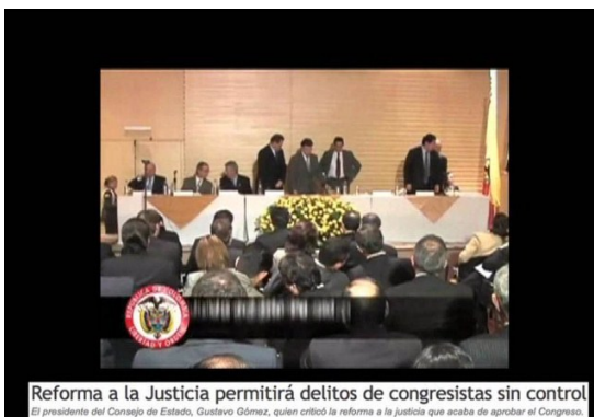
Reforma a la Justicia permitirá delitos de congresistas sin control. El presidente del Consejo de Estado, Gustavo Gómez, quien criticó la reforma a la justicia que acaba de aprobar el Congreso.

Hay que dejarle algo claro al país, que parece no tener memoria ni siquiera mediata, desde que el gobierno presentó el proyecto de reforma a la justicia este fue un esperpento; por una sencilla razón, el Gobierno pretende privatizar la justicia y estaba dispuesto a ceder lo que fuera necesario por conseguir ese cometido.