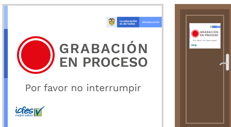
Ilustración 1. Ejemplo de aviso de grabación en proceso