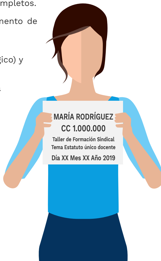
Ilustración 3. Ejemplo de la hoja de identificación