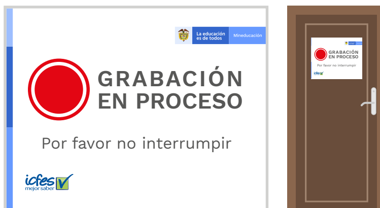
Ilustración 1. Ejemplo de aviso de grabación en proceso