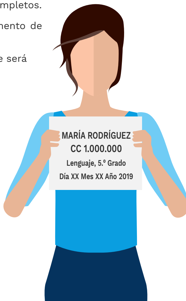
Ilustración 3. Ejemplo de la hoja de identificación